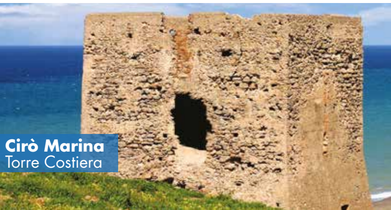
Cirò Marina Torre Costiera