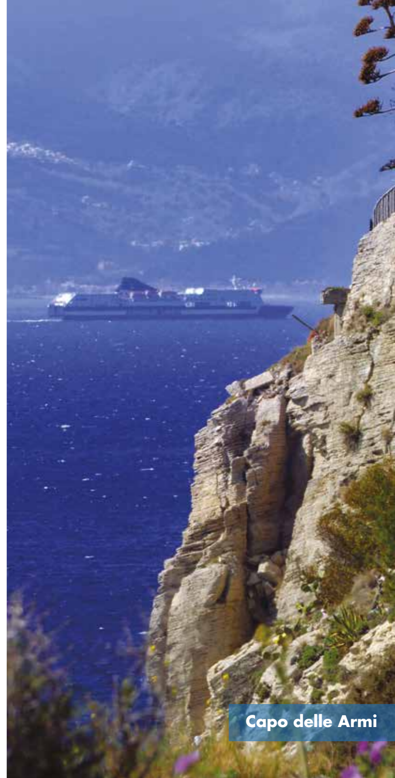
Capo delle Armi