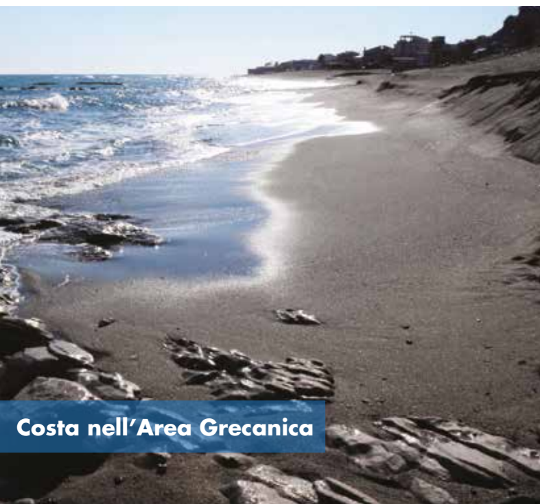
Costa nell'Area Grecanica

La zona è conosciuta anche per la coltivazione del bergamotto, un agrume da cui si estrae un'essenza molto richiesta per la preparazione dei profumi e distribuita in tutto il mondo.