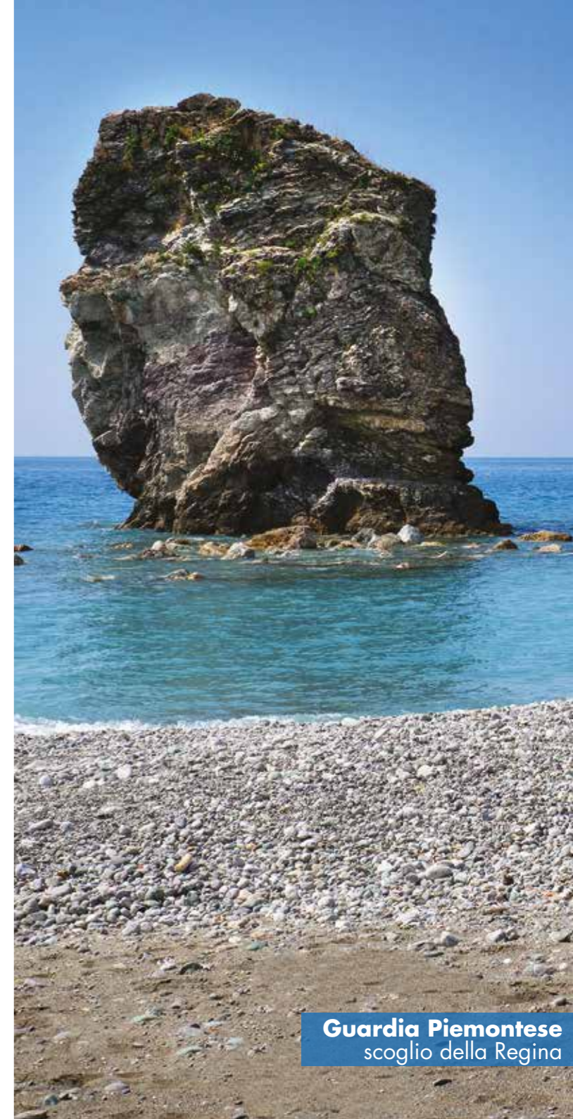
Guardia Piemontese scoglio della Regina