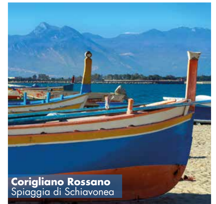
Corigliano Rossano Spiaggia di Schiavonea