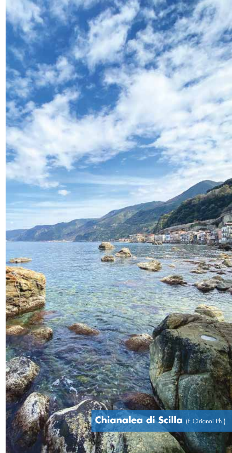
Chianalea di Scilla