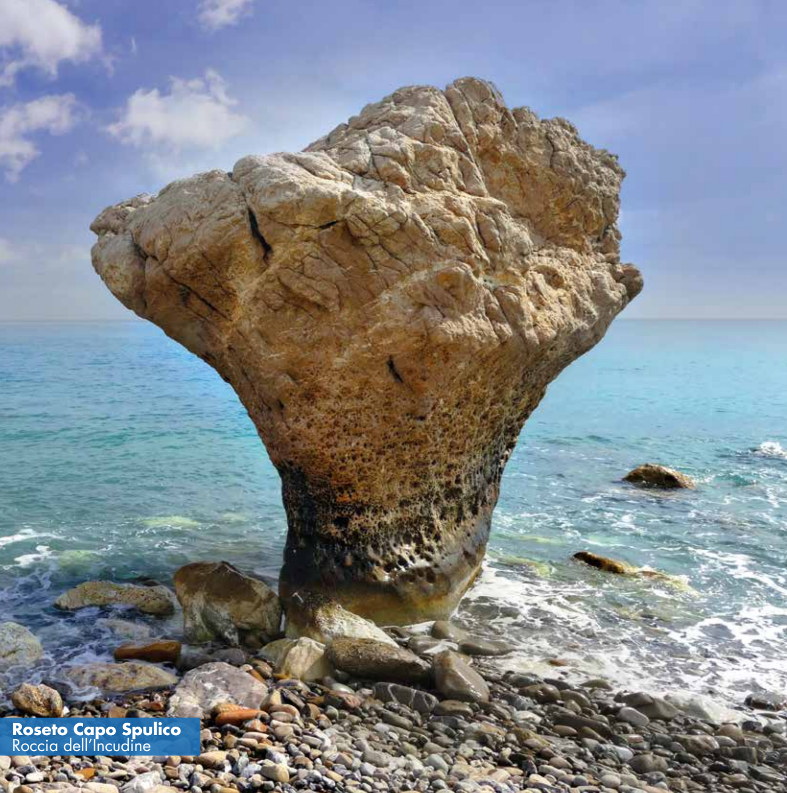
Roseto Capo Spulico Roccia dell'Incudine

grande Parco archeologico e il Museo della Magna Grecia. Ma la zona offre anche numerose strutture ricettive, tra cui i Laghi di Sibari uno splendido complesso residenziale e portuale con circa 3000 posti barca. Trebisacce è una località turistica balneare con un caratteristico borgo marino e un vivace porticciolo turistico e peschereccio. Il borgo è comunemente definito come Balcone dell'Alto Ionio perché dalle sue terrazze si può ammirare lo straordinario panorama delle pianure di Sibari e Metaponto. Proseguendo incontriamo Roseto Capo Spulico una delle mete turistiche più ambite della Calabria grazie al mare incantevole, alla natura incontaminata oltre che alle bellezze di alto valore come il Castello Federiciano, visitabile anche al suo interno e perfettamente conservato. L'itinerario si chiude con le bellissime vedute che offre al visitatore il centro storico di Rocca Imperiale ; considerato la porta d'ingresso della Calabria, si tratta di un borgo medievale tra i più pittoreschi dell'intera regione. Non a caso nel 2018 è entrato a far parte dei Borghi più belli d'Italia. Le bellezze naturali presenti unite al patrimonio architettonico e storico, al clima, alla posizione geografica tra il Parco Nazionale del Pollino, la Piana di Sibari e l'area del Metapontino, costituiscono un richiamo turistico molto forte fra gli itinerari della Calabria.