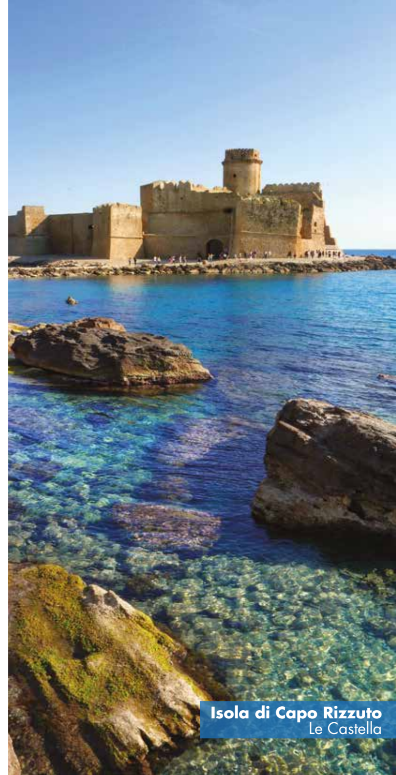
Isola di Capo Rizzuto Le Castella