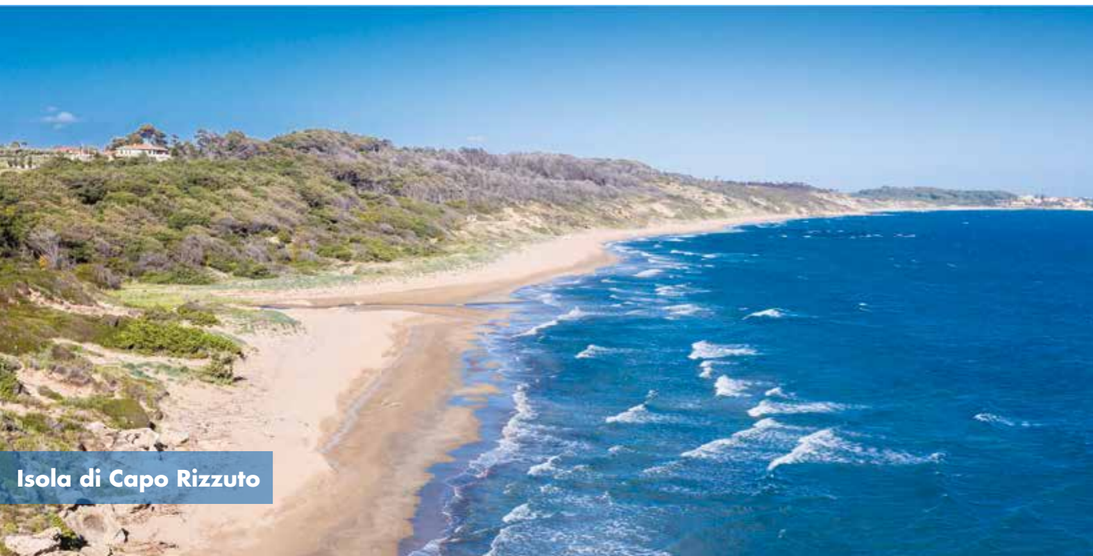
Isola di Capo Rizzuto

La zona, vicinissima alla penisola ellenica, veniva facilmente raggiunta dagli antichi coloni che fondarono la Magna Grecia e per questo è anche un'importante Area archeologica con un vero e proprio parco marino sommerso dalle acque ma visitabile con specifici itinerari subacquei.