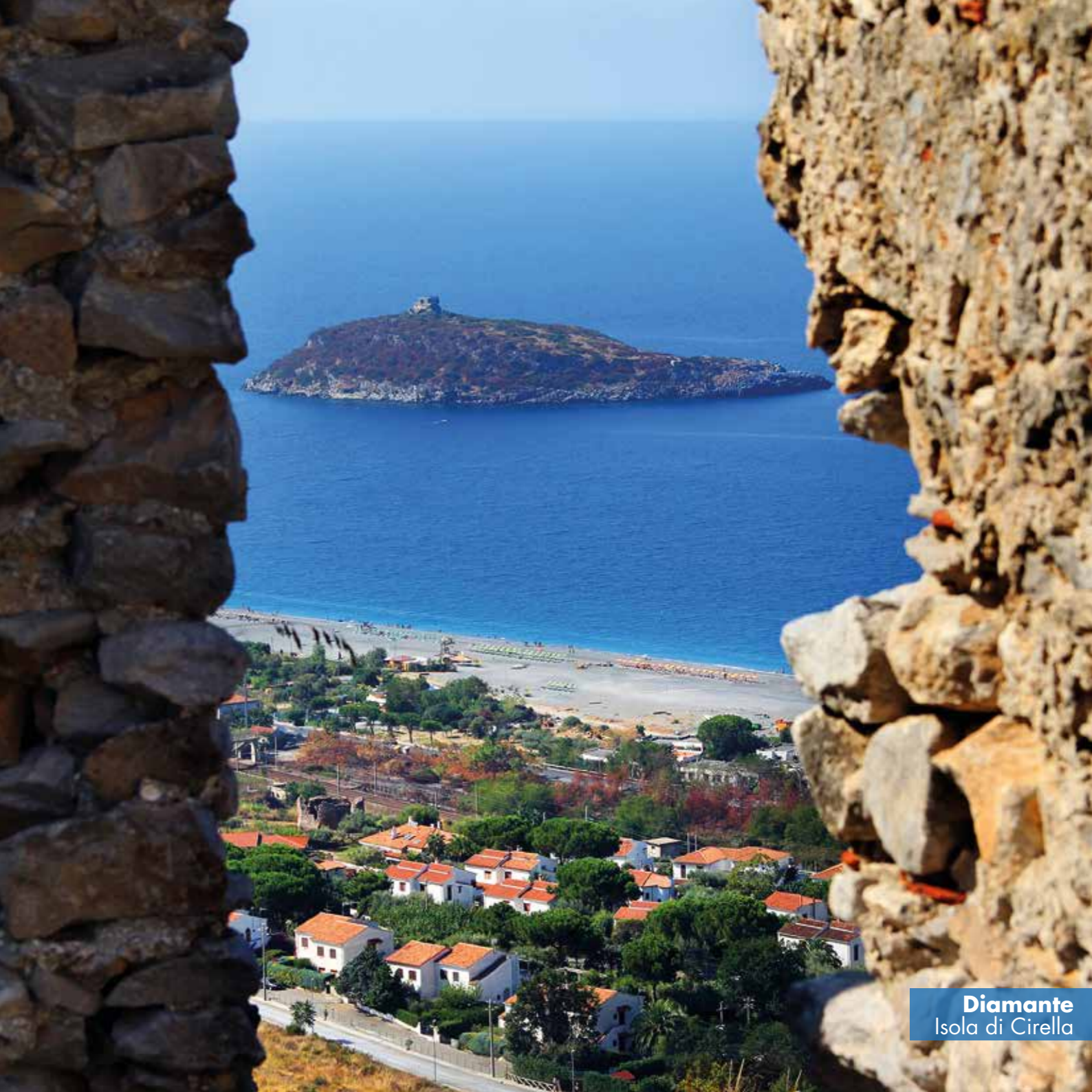
Diamante Isola di Cirella