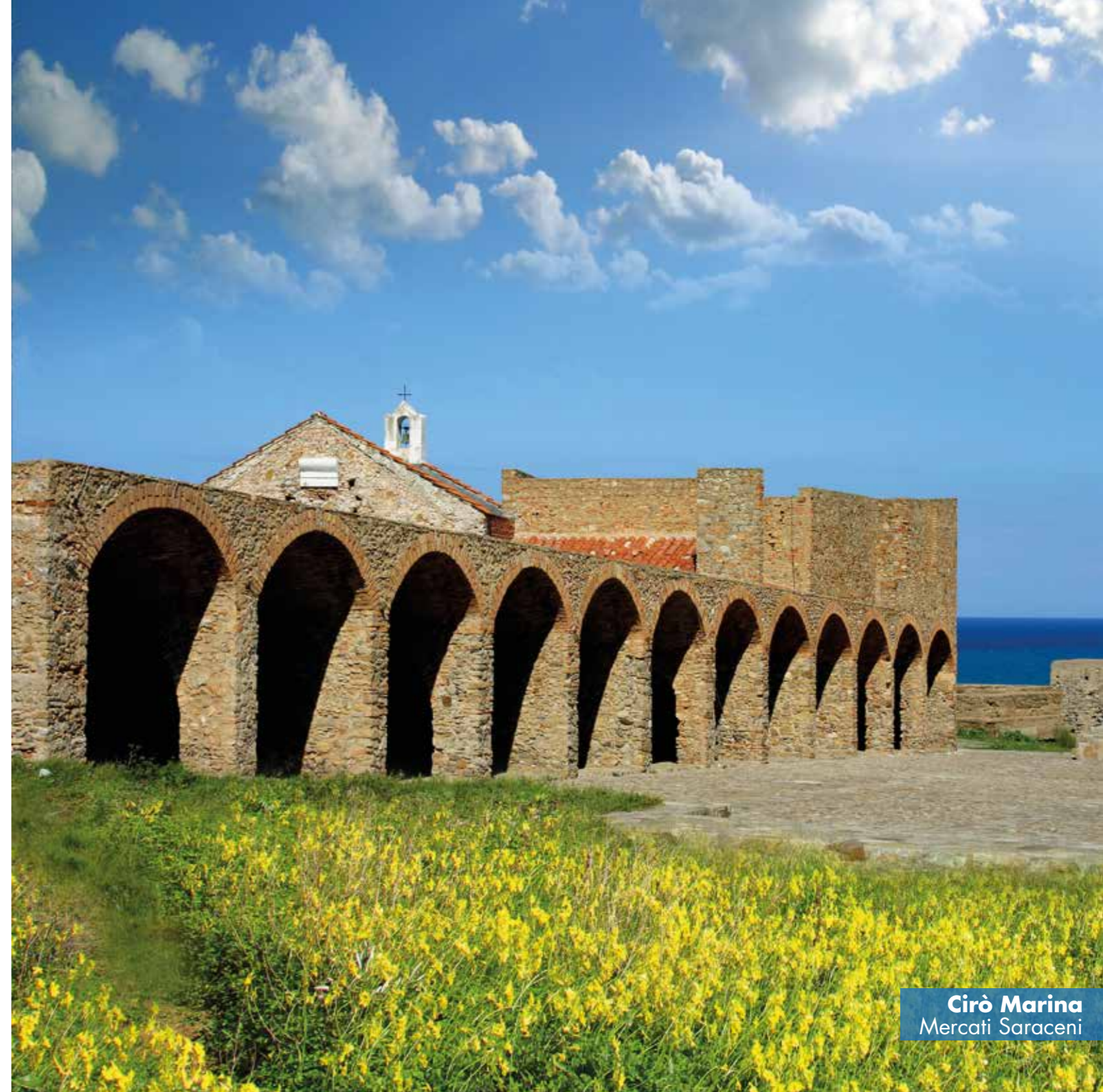
Cirò Marina Mercati Saraceni