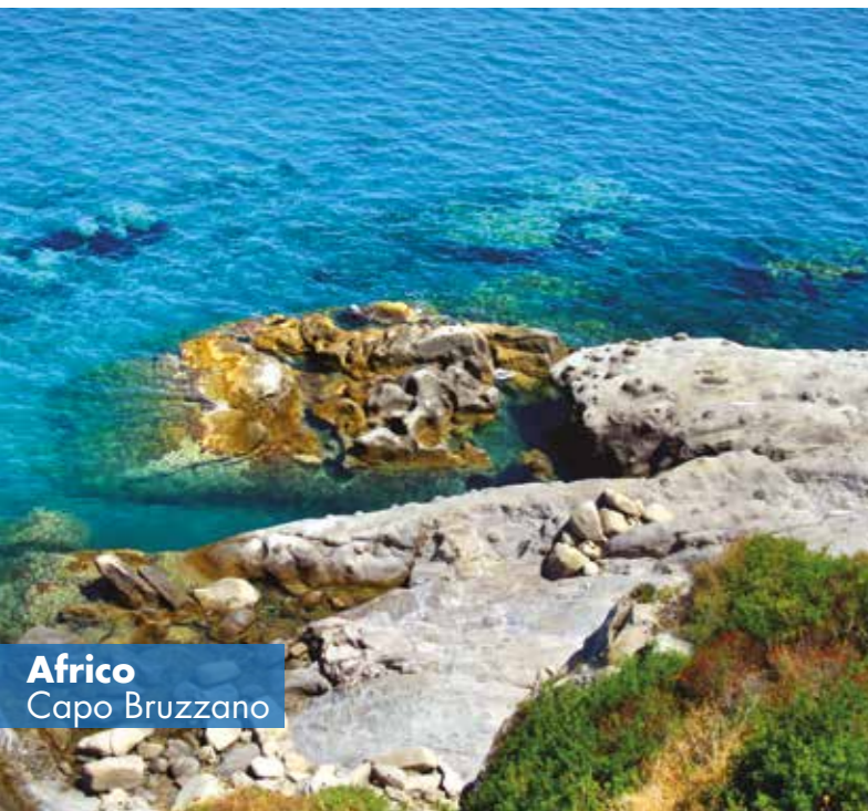
Africo Capo Bruzzano

Si snoda per 90 km con arenili bassi e sabbiosi racchiusi tra alte rocce a picco sul mare. La Riviera prende il nome dalla coltivazione della pianta di gelsomino diffusa in tutta la provincia reggina. Le grandi civiltà del passato hanno lasciato tracce indelebili in tali luoghi; per entrare nel vivo della storia si consiglia di visitare le aree archeologiche di Caulonia e Locri Epizefiri, la Cattolica di Stilo e la Cattedrale di Gerace. Nei suoi fondali sono stati ritrovati i famosissimi Bronzi di Riace.