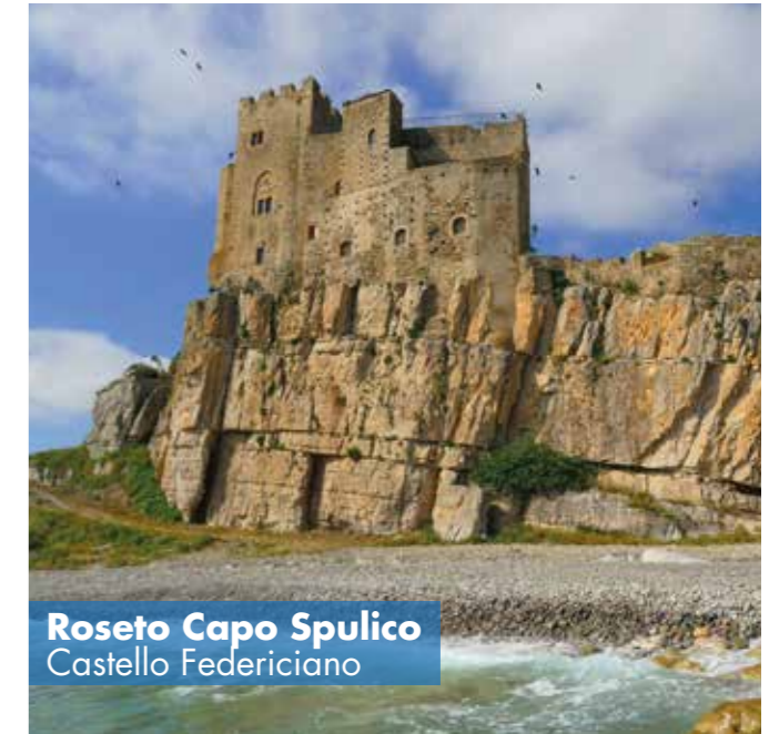
Roseto Capo Spulico Castello Federiciano