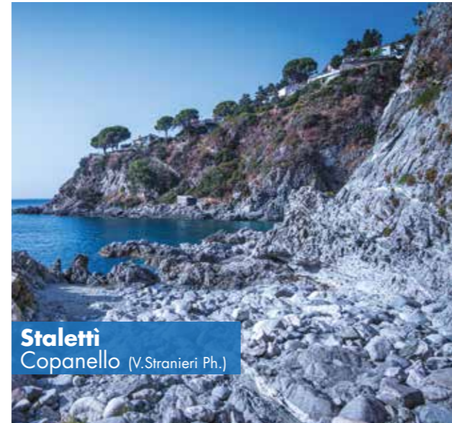
Staletti Copanello

resti della chiesetta bizantina di San Martino e, sulla costa, le suggestive scogliere di Caminia e di Pietragrande. Squillace è un comune della provincia di Catanzaro a forte vocazione turistica, posizionato a pochi chilometri dalla costa; Squillace Marina presenta alcuni chilometri di sabbia bianca e mare cristallino con la possibilità di godere del comfort dei numerosi stabilimenti balneari o, in alternativa, della tranquillità della spiaggia libera. Dirigendosi pochi chilometri a sud consigliamo di scoprire la piccola baia e le meravigliose scogliere del promontorio di Santa Maria del Mare. La zona è l'ideale anche per gli appassionati di windsurf, in quanto su questo tratto di costa si formano onde abbastanza grandi da cavalcare in quasi tutti i periodi dell'anno. A pochi minuti dalla città di Catanzaro, nel territorio di Borgia e affacciato sulla suggestiva spiaggia di Roccelletta, sorge il Parco Archeologico di Scolacium. Questo parco, con il suo foro romano, il teatro antico e il Museo Archeologico, costituisce una delle attrazioni più rilevanti e affascinanti della Calabria. Il luogo rappresenta un autentico tesoro in quanto testimonia la presenza di due delle più antiche città della regione: l'antica Skyllition di origine greca e la successiva Scolacium di epoca romana. Il quartiere marino della